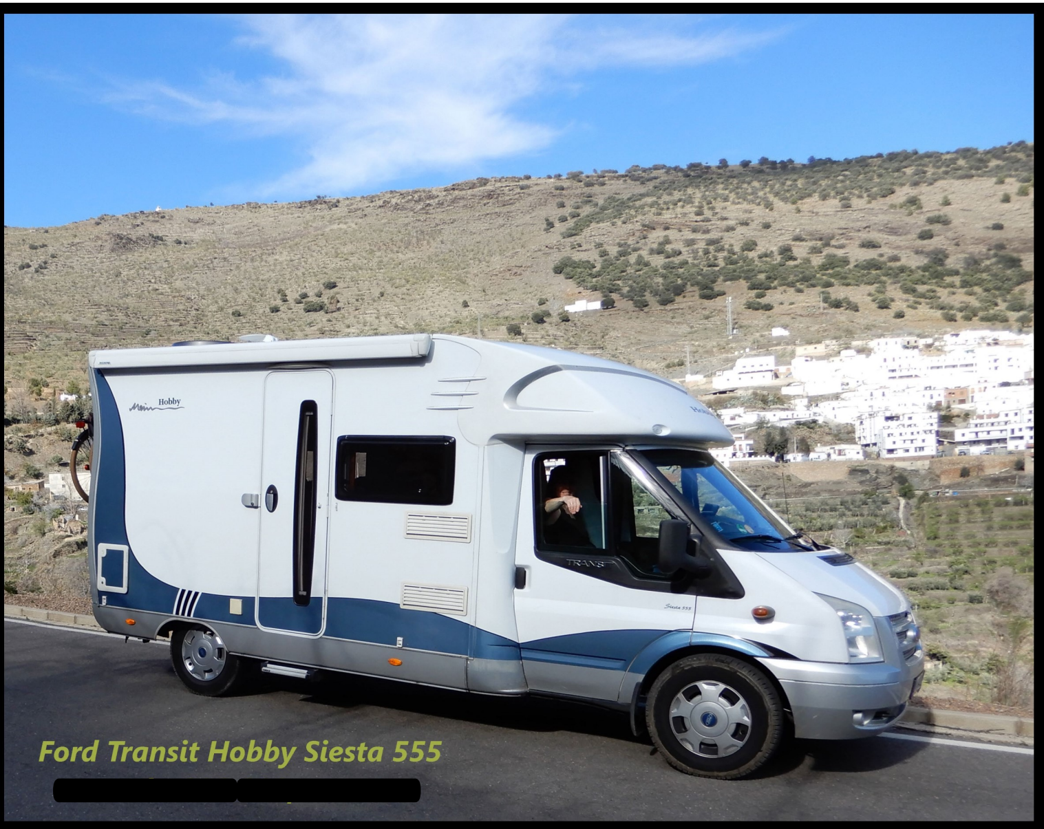
Ford Transit Hobby Siesta 555

Og tak for mange gode km. Gibraltar, Tjekkiet, Færøerne, Nordkap og meget mere